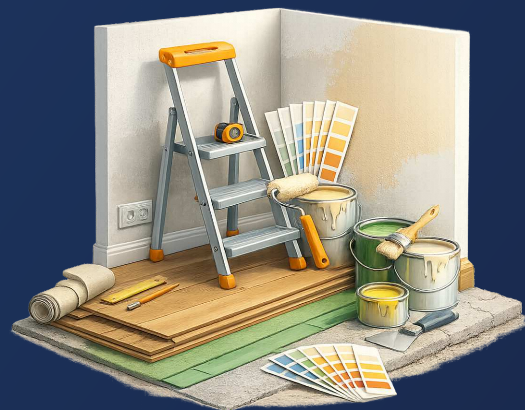
Чистовая внутренняя отделка