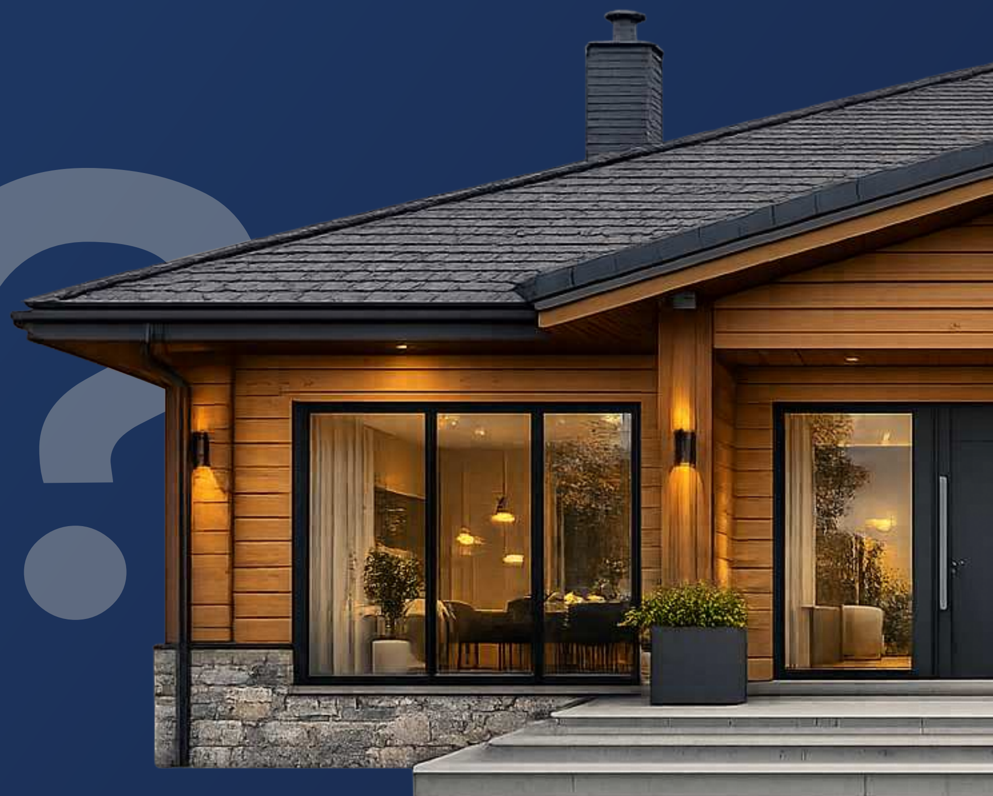
Дом выходного дня