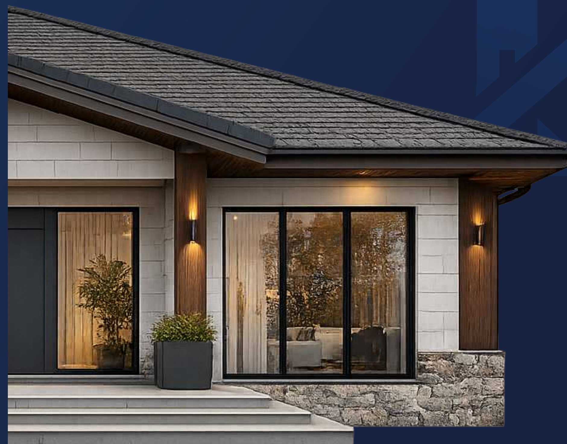
Дом постоянного проживания