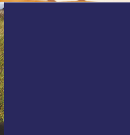
На фото представлено ООО «Очерский завод»