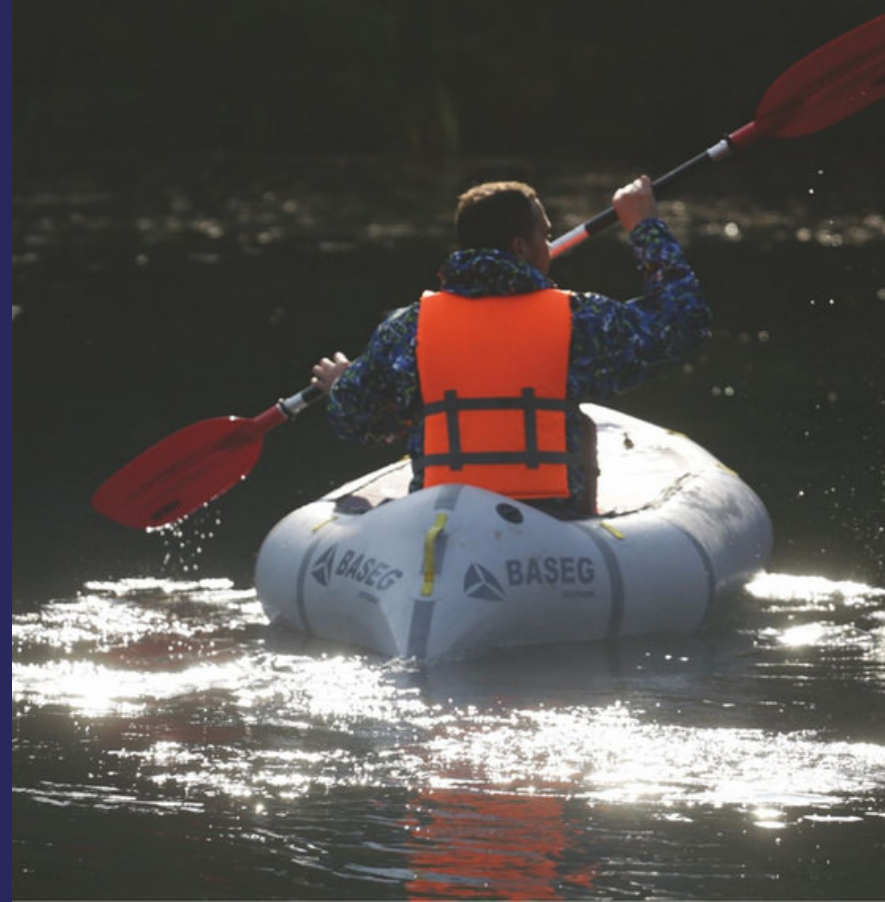
фото представлена продукция компания Baseg

Дать возможность потенциальным покупателям увидеть местных производителей и легко выбрать их среди других предложений.