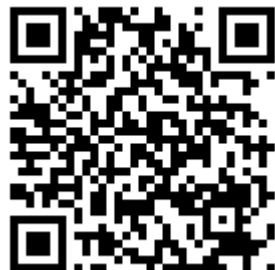
Дневники проекта. Выпуск №2