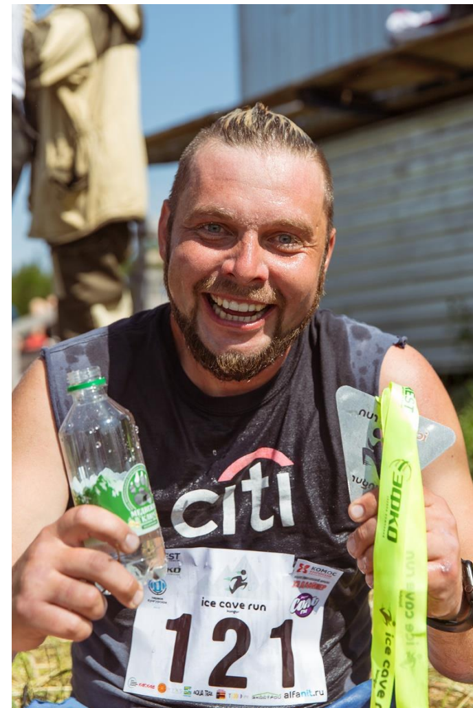
Участник забега Ice Cave Run