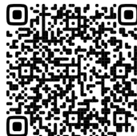
Дневники проекта. Выпуск №3