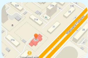
ул. Маршала Рыбалко, 29а