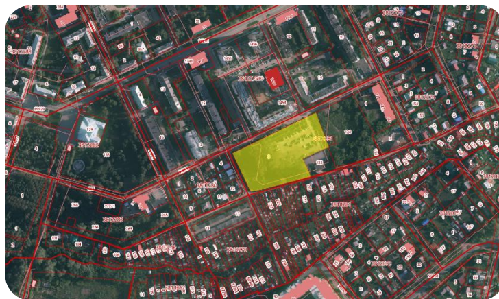
Орджоникидзевский район, ул. Белозерская, 48 59:01:3812281:3