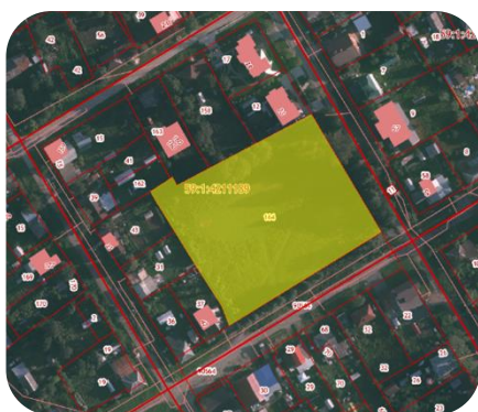
Мотовилихинский район, ул. Урицкого (стадион Буран) 59:01:4211189:164