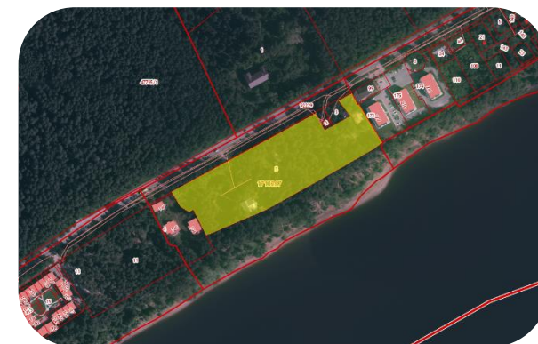
детский лагерь «Фортуна», ул. Кировоградская, 178 59:01:1713267:5