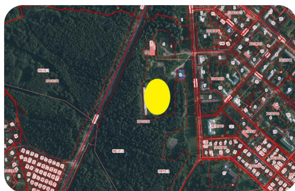
Мотовилихинский район, ул. Генерала Доватора, подлежит формированию (квартал 59:01:3810333)