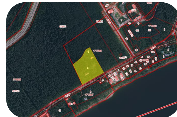
санаторий «Светлана», ул. Кировоградская, 171 59:01:1717068:1