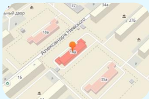
ул. Адмирала Нахимова, 14а

Механизм реализации: заключение концессионных соглашений в отношении существующих и неиспользуемых (законсервированных) детских дошкольных учреждений в целях предоставления услуг дополнительного образования