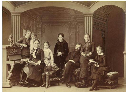
Основатель династии Третьяков Елисей Мартынович Купеческое семейное дело и создание галереи русского искусства