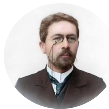
Антон Павлович Чехов

«Если Вы будете работать для настоящего, то Ваша работа выйдет ничтожной; надо работать, имея в виду только будущее».