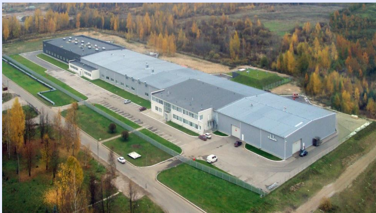
Дула РУ, Псков

01.08.2013 г. фирма Dula запустила международный проект: „Участок профобучения Дула РУ“ по германской системе