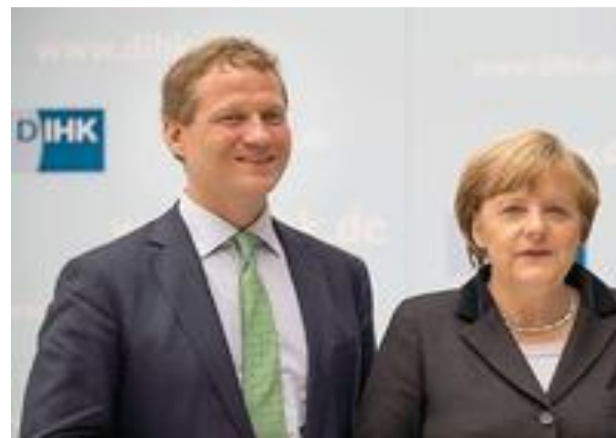
Президент IHK Эрик Швайцер с федеральным канцлером Ангела Меркель