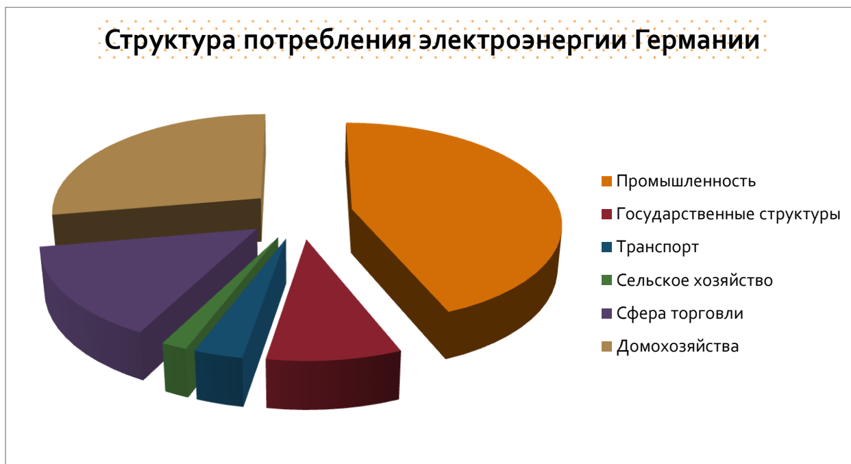
Диаграмма 2. Структура потребления электроэнергии Германии.

В 2013 году потребление электроэнергии возросло в промышленности на 6,7% (223 ТВт/ч), в транспортной сфере – на 3,8% (16,5 ТВт/ч), в государственных структурах – на 0,4% (45 ТВт/ч), в сельском хозяйстве – на 1,2% (8,7 ТВт/ч), в домохозяйствах – на 1,3% (141 ТВт/ч), в сфере торговли – на 1,5% (74,8 ТВт/ч).