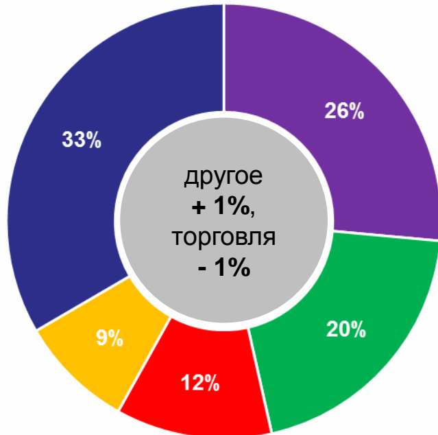
Членская база: отрасли